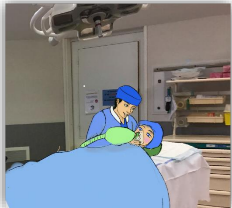
8 Anesthésie et opération