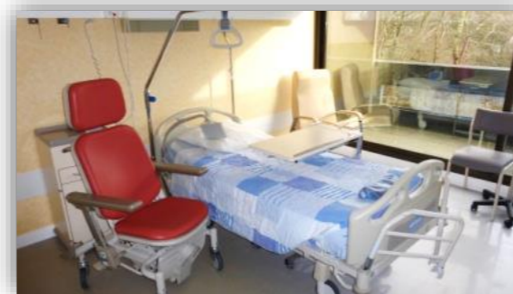
10 Retour en chambre