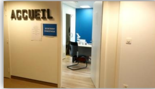
3 Consultation d'anesthésie