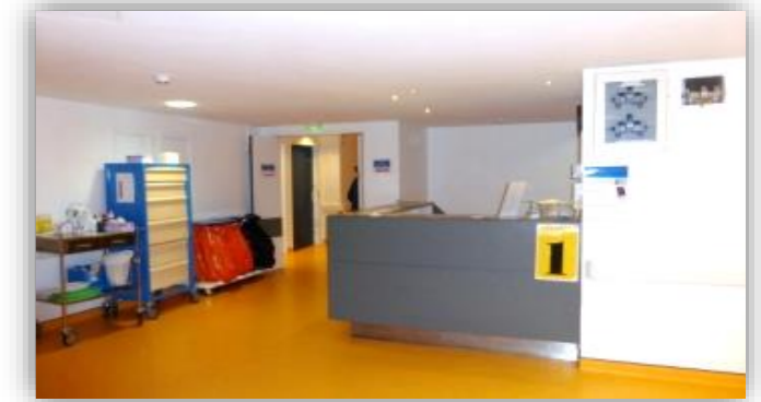
5 Arrivée dans le service