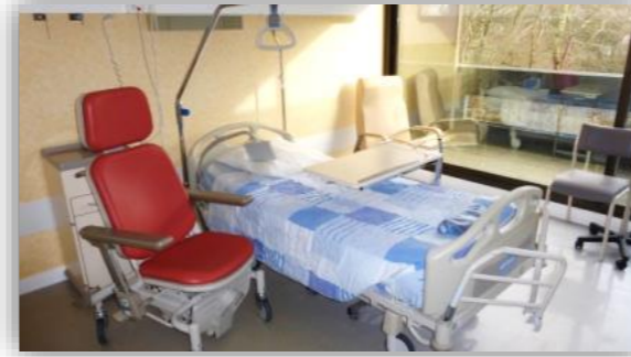
6 Installation en chambre