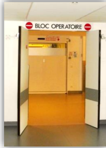
7 Départ au bloc opératoire