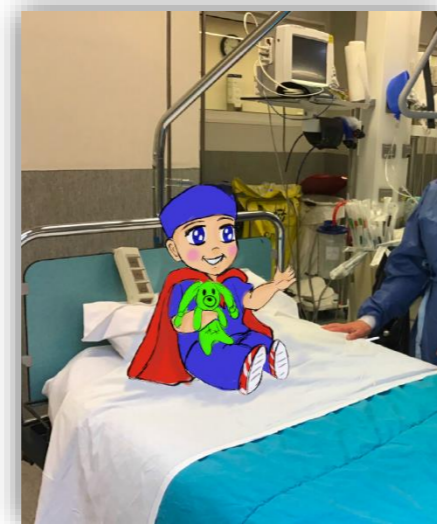
9 Salle de réveil